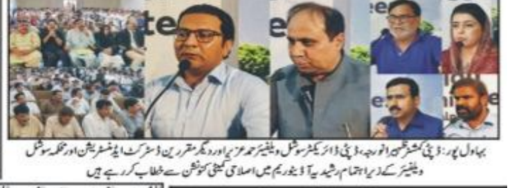
بہاولپور، ڈیڑھ گھنٹہ کی تقریب میں وزیر اعظم اور دیگر مقررین نے وزیر اعلیٰ پنجاب کو سندھ کے وزیر مقرر کیا۔

یورپ کا سفر مزید آسان، سیاحتی ٹیکنان ویزا اب آن لائن دستیاب ہوگا یورپ کا سفر مزید آسان، سیاحتی ٹیکنان ویزا اب آن لائن دستیاب ہوگا یورپ کا سفر مزید آسان، سیاحتی ٹیکنان ویزا اب آن لائن دستیاب ہوگا