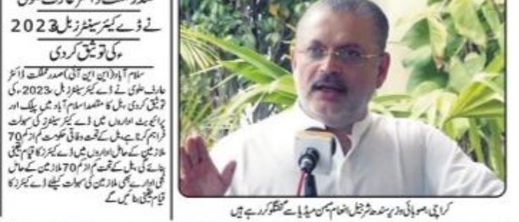
کرچی میں ڈیڑھ گھنٹہ کی تقریب میں وزیر اعلیٰ پنجاب کو سندھ کے وزیر مقرر کیا